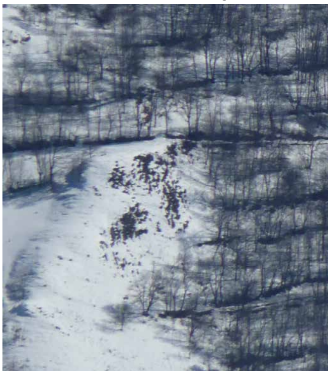
Bocage de frênes dans la vallée du Louron dans les Pyrénées