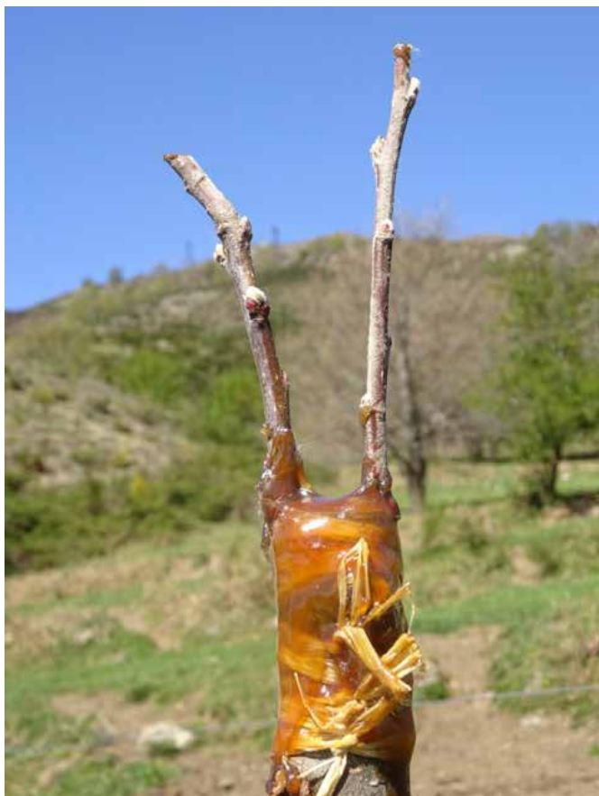
Greffage de pommier