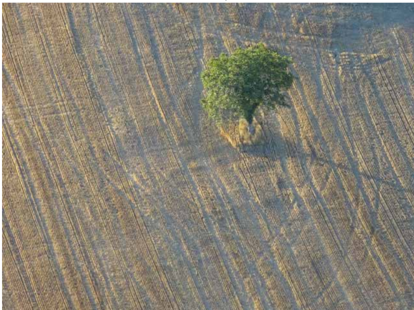
Arbre isolé dans un champ de céréales