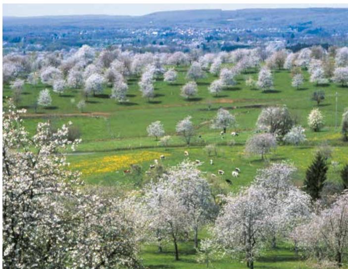
Prés vergers de cerisiers de Fougerolles (Haute-Saône) utilisés pour la production de kirsch AOC

Les notes « Signé PAP » consacrent trois articles au thème du retour de l'arbre champêtre dans le paysage de l'après-pétrole. Retrouvant l'alliance millénaire de l'homme et de l'arbre, le paysage de l'après-pétrole sera un paysage dense en arbres ! Pour se passer des engrais issus du pétrole et de l'usage toxique des pesticides, l'agro-écologie sera amenée à retravailler les configurations spatiales que l'agriculture industrielle a eu tendance à privilégier et à généraliser - agrandissement des parcelles, comblement des fossés, arasement des levées de terre, arrachage des haies et des lignes d'arbres, rectification des cours d'eau. Ce faisant, et différemment selon chaque contexte local, l'agriculture retrouve la multitude des fonctions de l'arbre dans le système agricole et ravive ainsi une mémoire que l'ère du pétrole avait tendu à effacer.