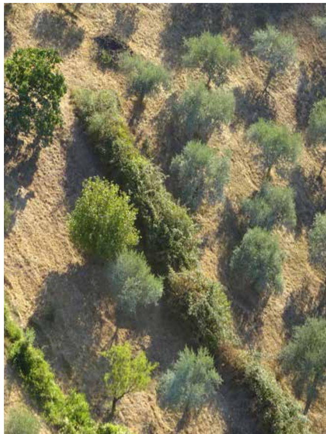
Agroforesterie traditionnelle méditerranéenne avec olivier, amandier, noyer, et figuier

jusqu'à une période récente. Ces savoir-faire couvraient les techniques de plantation et les différentes formes de valorisation du bois, car les paysans connaissaient chacune des essences et l'usage qu'ils pouvaient en faire. L'arbre champêtre ne doit rien au hasard ou si peu. Les connaissances portaient sur le port des arbres, leur résistance au gel ou au vent, leur capacité à se régénérer après la taille, les meilleures dates d'abattage en fonction de la lune et des usages du bois. Elles concernaient aussi les bonnes utilisations du bois en fonction de son essence. Les savoir-faire couvraient des domaines très larges et portaient principalement sur la gestion et l'entretien des arbres et de leurs structures arborées, mais aussi sur le travail du bois et la valorisation des fruits, avec des spécialités ou spécialisations : travail de l'osier, sériciculture, fabrication du cidre ou des alcools de fruits, fabrication de fourches en micocoulier. Ces savoir-faire paysans différaient de ceux des forestiers, sauf pour le travail du bois. Ces deux mondes ne se fréquentaient guère : le forestier a tout fait pour chasser de ses forêts le paysan et ses bêtes sauf, en France, dans les prés-bois du Jura et dans les peuplements forestiers les plus extensifs, comme en forêt méditerranéenne, où la cohabitation perdure avec le pâturage.