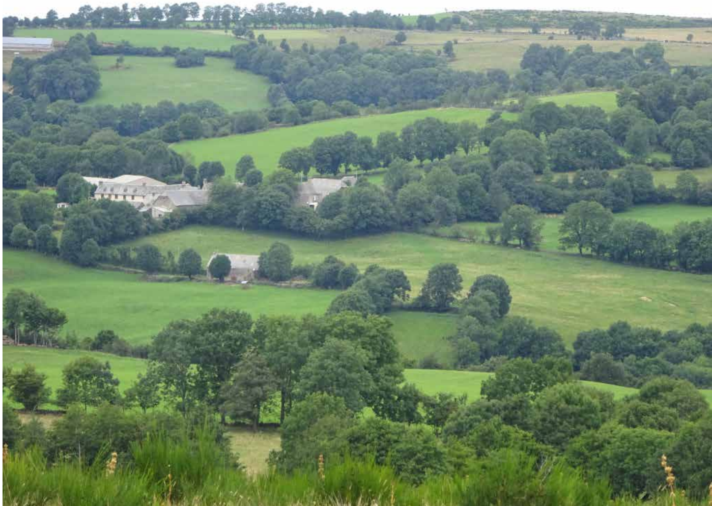
Bocage de l'Aubrac à base de frênes

Ce rêve est néanmoins partagé aujourd'hui par de nombreux paysans qui respectent, replantent, entretiennent et valorisent les arbres. Ils auront la tâche essentielle de convaincre leurs voisins de changer leurs pratiques. Les élus locaux devront aussi être proactifs en accompagnant par exemple le développement des chaufferies à bois. Les politiques devront être plus favorables en rémunérant les services rendus. Mais le changement escompté prendra du temps car l'arbre a un point faible, il est long à pousser. Alors il est plus que temps d'agir.