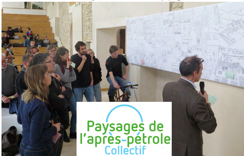
Animation autour de la fresque, AG PAP 2016. Cité des paysages, colline de Sion

Julien Dossier, Renaissance écologique. 24 chantiers pour le monde de demain , éd. Actes Sud, 256 pages https://www.renaissanceecologique.fr