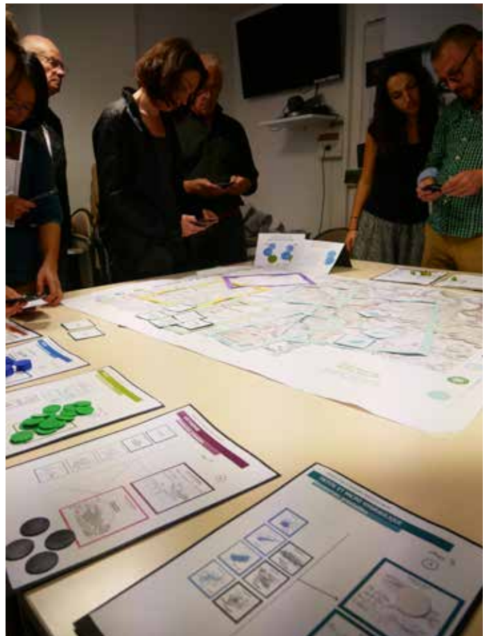
Fiches qui mettent en regard ressources paysagères et actions MDE ou ENR (étape 3).

Les étapes 4 et 5 créent un nouveau paysage énergétique par la photo, le dessin et la micro-fiction. L'approche sensible du paysage est restituée par le récit et des propositions graphiques