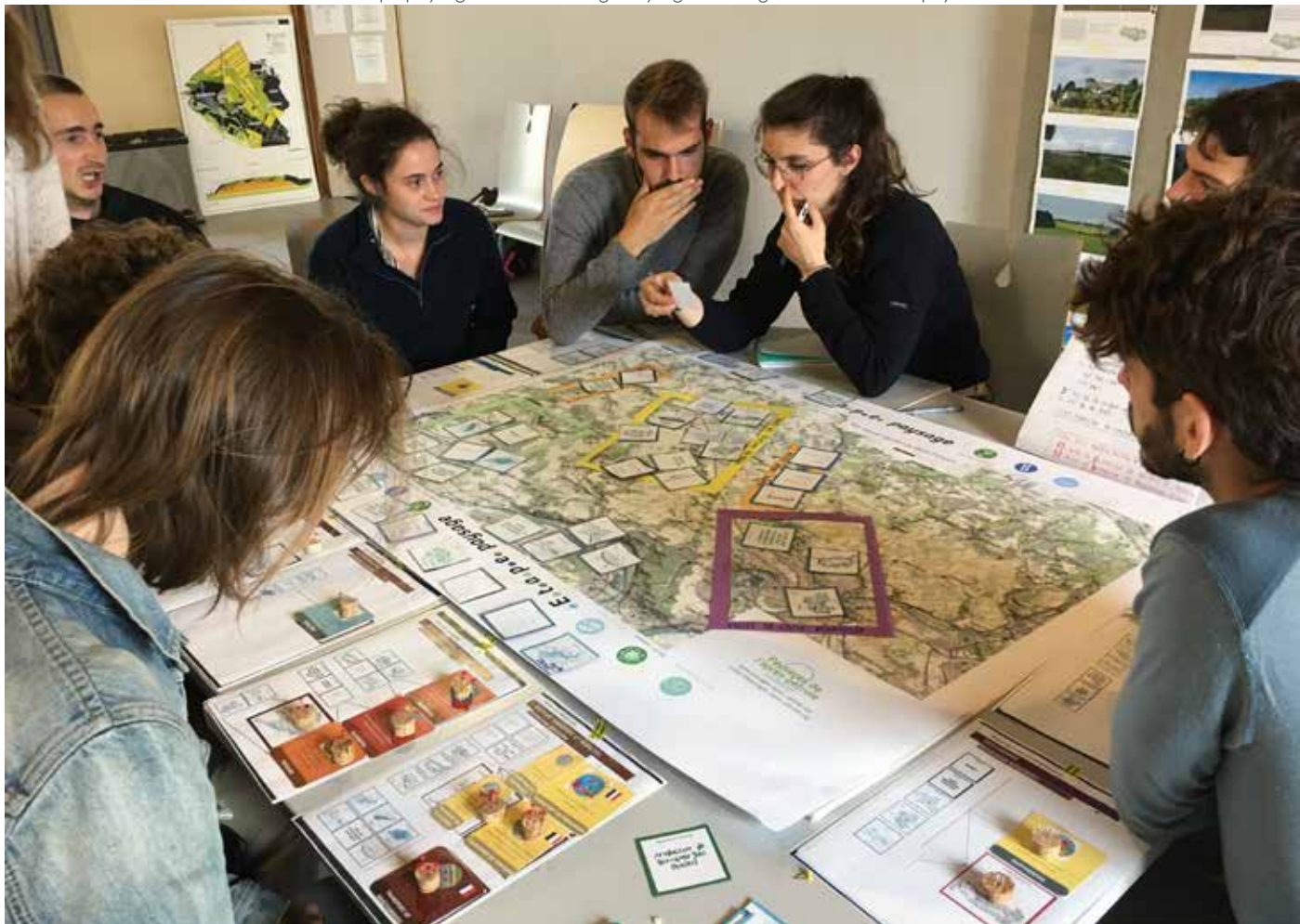
Etape paysage en séminaire AgroPaysage à la Bergerie de Villarceaux (95)

méthaniseurs plutôt que des éoliennes (ou l'inverse), etc.