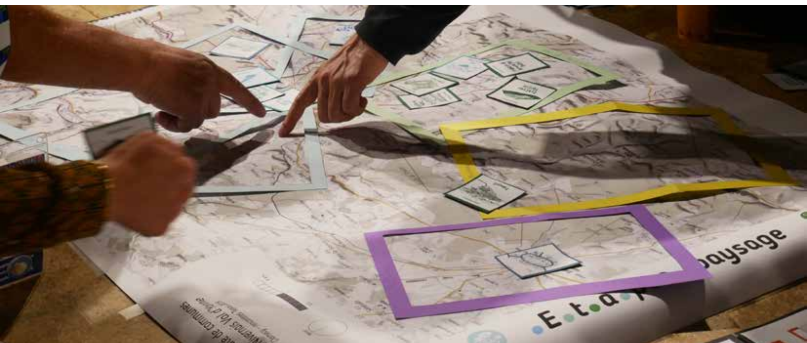
Test du jeu sur le territoire du Haut Nivernais Val d'Yonne à l'occasion des rencontres nationales Tepos 2019 à Clamecy