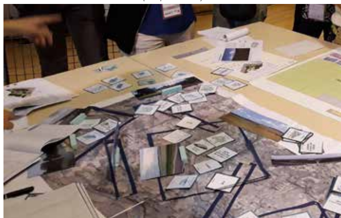
Exemple de "cartes ressources" mobilisées à l'étape 2